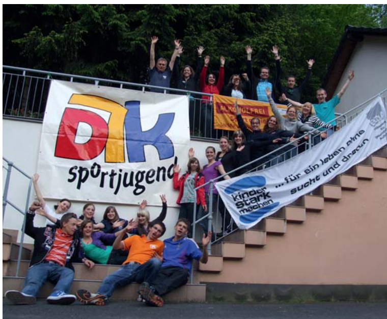
Team. Alle freuten sich über drei gelungene Tage

Na ja, mit zwölf Mädels in einem Zimmer in Hochbetten übernachten, diese Überraschung war schon einmal gelungen und echt Spaßig. Schnell waren Barbara und Angela mitten im Thema, originale Filmaufnahmen der vergangenen olympischen Spiele von London, Helsinki oder auch von Rom und Melborn sowie interessante Hintergrundgeschichten brachten sie zum Nachdenken und Reflektieren über die Dimension der olympischen Idee. Pierre de Coubertin, der Begründer der