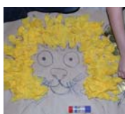
Kreativität. Mit viel Geschick entstanden tolle Sachen.

An welchen verlassenen Ort hatte die DJK-Sportjugend die beiden jungen Frauen entführt? Doch schnell war ihnen klar, dass hier ein spannendes, interessantes und abwechslungsreiches Wochenende auf sie wartete. Die anderen Jugendlichen, die sich gemeinsam mit ihnen auf den DJK-Olymp machen wollten, waren gerade