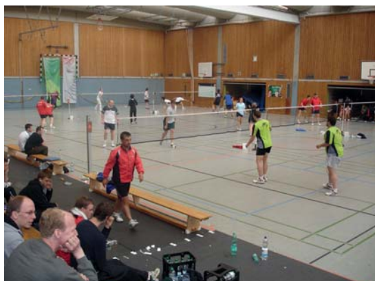
330 Spiele wurden an zwei Tagen absolviert - alle ohne Schiedsrichtereinsatz.