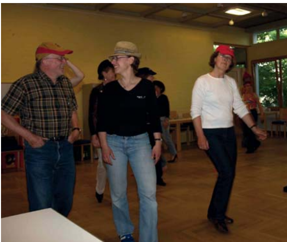
Beim Buchstabenlegen (oben) und beim Flanieren mit den Hüten kommt es zu Begegnungen

Zur Intensitätssteigerung können auch mehrere Personen in der Mitte gleichzeitig tätig sein. Allerdings muss dann das Kommando „Zipp-Zapp“ sehr laut gerufen werden, weil dies immer für alle gilt.