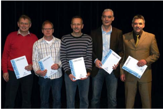
Die Vertreter der DJK-Vereine aus Betzdorf, Herdorf, Dist, Plaidt und Oberwesel bei der Preisverleihung in Boppard

Der organisierte Sport steht vor großen Herausforderungen. Um diese besonders auch in wirtschaftlich schwierigen Zeiten zu bewältigen, braucht er ein starkes Management und starke Partner. Dies war der Tenor bei der diesjährigen Preisverleihung des Wettbewerbes „Der zukunftsfähige Sportverein“, den der Sportbund Rheinland zum dritten Mal gemeinsam mit der RWE Rhein-Ruhr AG ausgeschrieben hatte. 34 Sportvereins-Vorstände hatten sich in 2008 im Rahmen des Wettbewerbes jeweils einer Klausur unterzogen und erarbeiteten unter professioneller