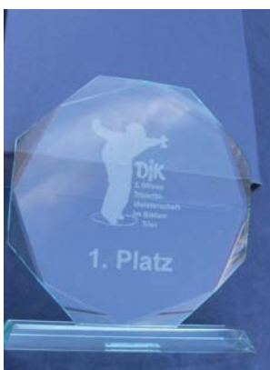
DJK-Pokal. Der gläserne Pokal spornte die Teilnehmer/innen an

Da im kommenden Jahr über Pfingsten das DJK-Bundessportfest in Krefeld stattfindet, bei dem auch ein Doublette- und Triplette-Turnier angeboten wird, werden voraussichtlich die nächsten Meisterschaften im Bistum Trier im Jahre 2011 durchgeführt. Nach dieser schönen Premiere in Oberwesel war dies ein klares Votum der 50 aktiven Boulespielerinnen und -spieler.