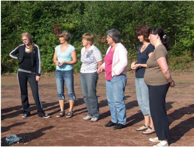
Das Mehr in der DJK erleben. Zum Beispiel bei einem Impuls zum Murmelspiel

In den vergangenen sieben Jahren wurden aus 12 DJK-Sportvereinen des Bistums Trier 48 Übungsleiter/innen