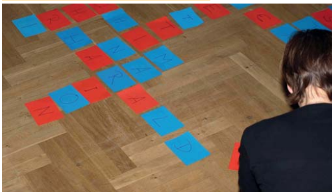
Die Vornamen aller Teilnehmer werden mit vorbereiteten Buchstaben nach Scrabble-Art zusammengelegt

Sind alle Namen fertig gelegt, stellt sich jeder nochmal zu seinem Namen und nennt ihn laut, zusätzlich zählt er ob