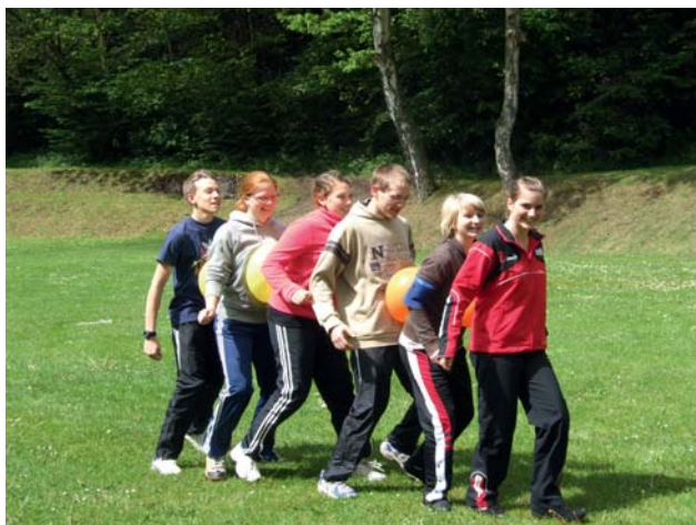
Kette. Lustige Spiele standen auf dem Programm des Jugend- events