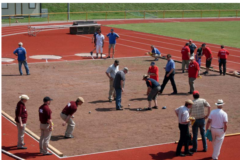
Pétanque pur. Spannende und interessante Spiele gab es in Oberwesel