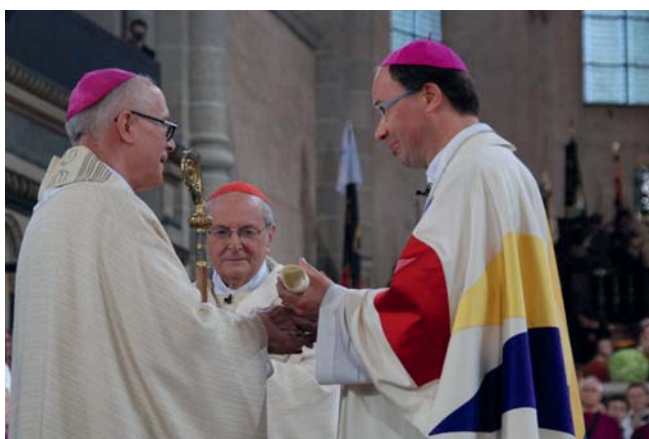
Ernennung zum Bischof von Trier

Im Anschluss an den Gottesdienst zogen der neue Trierer Bischof, die Ehrengäste und viele Gläubige zu einem Empfang ins Bischöfliche Priesterseminar. Grußworte sprachen hier unter anderem der rheinland-pfälzische Ministerprä-