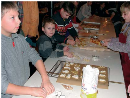
Die Weihnachtsbäckerei hat nicht nur bei Rolf Zuckowski eine enorme Anziehungskraft. Auch im Weihnachtsdorf der DJK war sie stets von jungen Bäckern umlagert.

Zu zwei besinnliche Stunden hatte die DJK Betzdorf am 3. Advent alle Mitglieder und Freunde in die Stadthalle in Betzdorf eingeladen und fast 500 große und kleine Besucher waren der Einladung gefolgt. Während die Erwachsenen bei Kaffee und Kuchen Zeit hatten, einem sowohl anspruchsvollen wie abwechslungsreichen Bühnenprogramm mit adventlicher Musik, klassischem oder popigem Tanz sowie einem „improvisierten“ Krippenspiel zu folgen, wurde den kleinen Gästen ein anregendes Mitmachprogramm im aufwendigen Weihnachtsdorf geboten. Leckere Plätzchen in der Weihnachtsbäckerei, Christbaumschmuck aus Tonpapier oder Sperrholz, lustige Vögel, Nikoläuse und vieles mehr regte die Phantasie der kleinen Gäste an und lud zum vorbehaltlosen Mitmachen ein. So entstand in der großen Halle eine adventliche Atmosphäre, die sowohl die großen als auch die kleinen Gäste begeisterte. „Ich möchte mich für die wunderschöne Betreuung, die vielfältigen Bastelangebote sowie die anregenden Stunden herzlich bedanken“, so der O-Ton einer Besucherin, deren Kinder sicherlich einen spannenden Nachmittag im Kreise der „DJK-Familie“ erlebt hatten. (am)