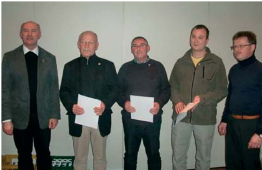
Geehrt für 25jährige Mitgliedschaft im Verein.