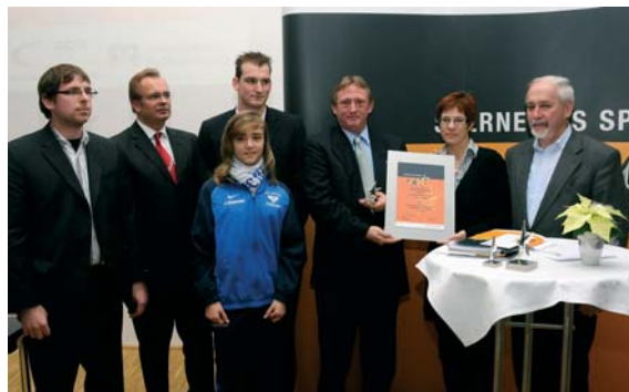
Hohe Auszeichnung für die DJK Dillingen.

Nach dem Gewinn des großen Stern des Sports in Bronze qualifizierte sich die DJK Dillingen für den Landesentscheid im Konferenz-