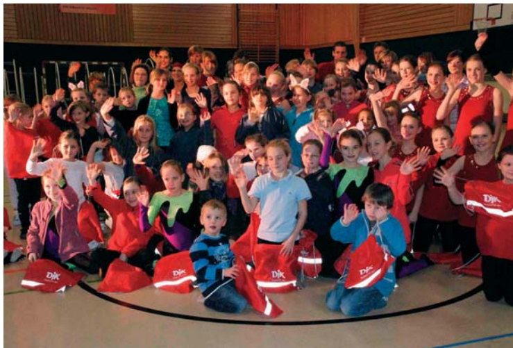
Nach dem Schauturnen noch schnell einen Blick in die Kamera werfen.