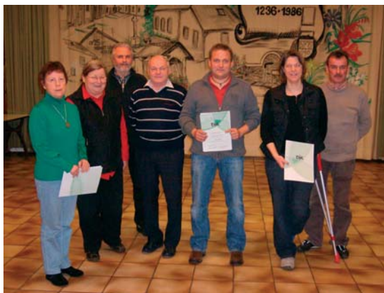
Auch dieses Jahr wurden einige Mitglieder für Ihre langjährige Treue zum Verein geehrt.