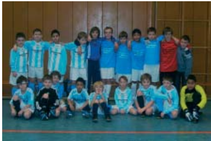
E-Junioren: Das Team der DJK 08 Rastpfuhl siegte.

http://www.cms.djk-dv-trier.de/173-0-Ergebnisse-DJK-Saarlandpokal-2010.html