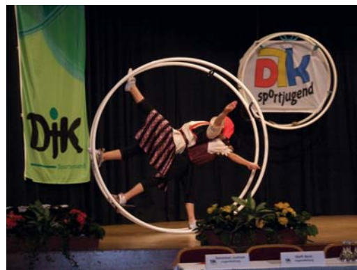
Die Rhönradturner unterhielten die Delegierten und Gäste beim Diözesantag 2008 in Betzdorf.

Die Einladung zum Diözesantag wird den Vereinen Mitte März zugeschickt. Anträge müssen nach der gültigen Satzung bis zum 05. März 2010 bei der DJK-Geschäftsstelle in Trier vorliegen.