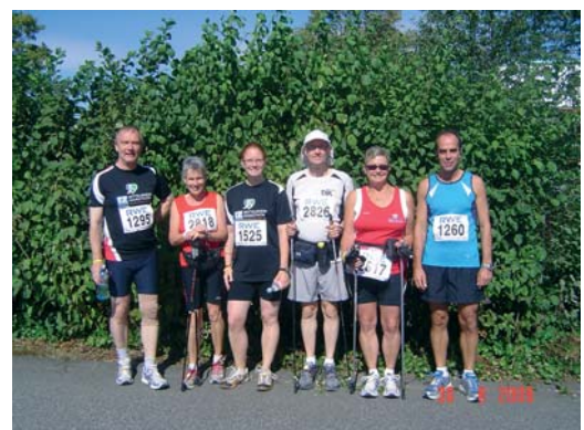
Die Starter der DJK Oberwesel beim 9. Hunsrück-Marathon