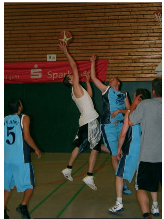
Das hart umkämpfte Finale zwischen dem TV Alzey und dem Team „Die Überspitzen“.

Die Veranstalter der DJK Sportjugend Oberwesel und der Sportjugend des Landessportbundes Rheinland-Pfalz bedanken sich recht herzlich bei den Sponsoren und allen Helfern, die es erst möglich gemacht haben eine solch tolle Veranstaltung durchzuführen. Unterstützt wurde das ganze vor Ort von: Volksbank Rhein-Nahe-Hunsrück, Autohaus Becker, Tengelmanmarkt, Brillenbrager, Floristik Persch und Zimmerei Walter Kastor.