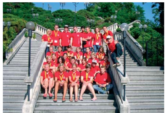
Die deutsche Delegation beim FICEP-Camp

Nach diesen tollen Tagen mussten dann mehr als 200 Teilnehmer Abschied nehmen von vielen neu gewonnenen Freunden und Freundinnen und hoffentlich auf ein Wiedersehen im nächsten Jahr.