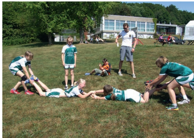
Möhren ziehen. Ein Spiel das so richtig Spaß machte und intensiv gespielt wurde.

Es kann natürlich der gestaltete DJK-Gottesdienst sein, der auf den Sportstätten das Spielfest eröffnet oder beschließt. Es darf aber auch eine Nische der Ruhe und Meditation geschaffen werden, die zum Entspannen, Reflektieren und Inspirieren dient. Der Kreativität sind keine Grenzen gegeben und so lassen sich Impulse ganz besonderer Art platzieren. Ob Mandalamalen für die Kinder, meditativer Tanz für die Älteren oder eine Wohlfühlreise für die Eltern, für vieles gibt es sicherlich einen Raum und Zeit.