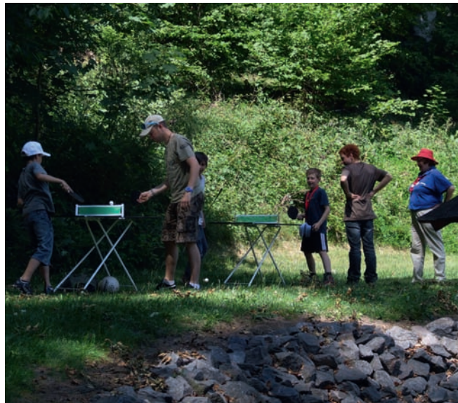
Begeisterung beim Mini-Tischtennis-spiel. Ping Pong auf den kleinen Tischtennisplatten machte den Kindern und Jugendlichen mächtig Spaß.

Auf der herrlichen Anlage angekommen, erwartete die Pilgerinnen und Pilger ein buntes Programm mit über 50 familienbezogenen Workshops. Neben Bastelangeboten, Gesprächsrunden, naturwissenschaftlichen Experimenten, offenem Singen, einer Klosterrallye und Führungen durch die Klostergärtnerei sowie durch die Glockengießerei bot der DJK-Diözesanverband Trier drei Trendsportarten zum Kennenlernen und Ausprobieren an.