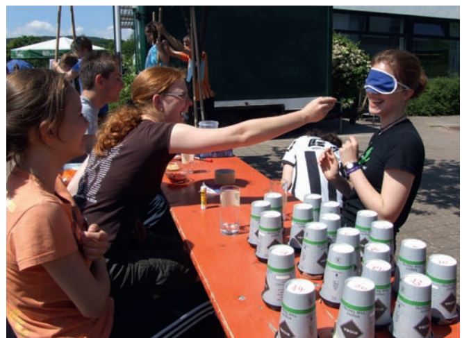
Sinne. Natürlich wurden auch die Sinne trainiert. Hier der Geschmackssinn, durchaus spaßig.