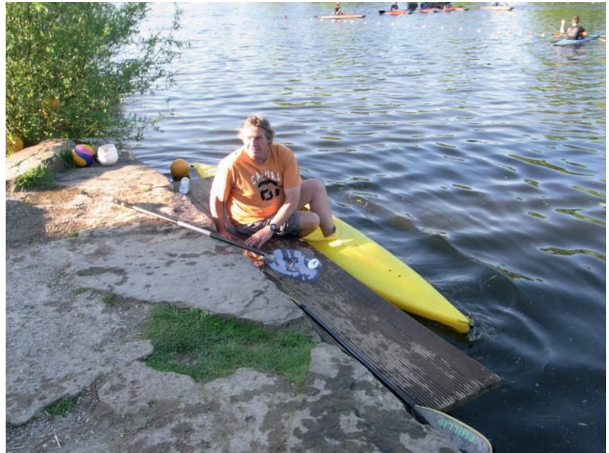
Einstieg ins Boot.

Die Nähe und Distanz zwischen den einzelnen Booten variiert genauso wie das Temperament der Paddler einer Gruppe. Der eine ist eher forsch. Er will die Strecke schnell überwinden. Der andere geht es moderater an, begibt sich ganz in die Obhut der Gruppe; wieder ein anderer sucht die Nähe