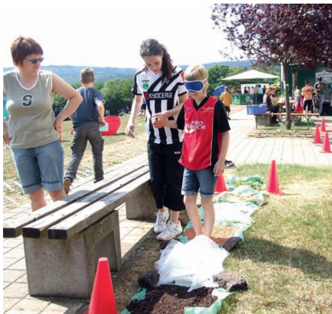
Tolle Stationen. Kreative und interessante Spielstationen entwickelten die Jugendlichen für die Kinder aus Oberthal, die sichtlich Spaß hatten.

wurden. Neben Bewegungsspielen für Einzelne und für Gruppen, gab es Spiele zur Förderung der Kreativität und interessante Spiele für die Sinne. Dabei half auch das Sportmobil des Sportbundes, das mit tollen Bewegungsangeboten