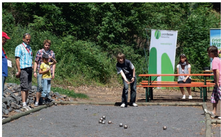
Zielgenauigkeit beim Pétanque. Ein gutes Gefühl für die Kugel und die Bahn entwickelten die Teilnehmer beim Boule.