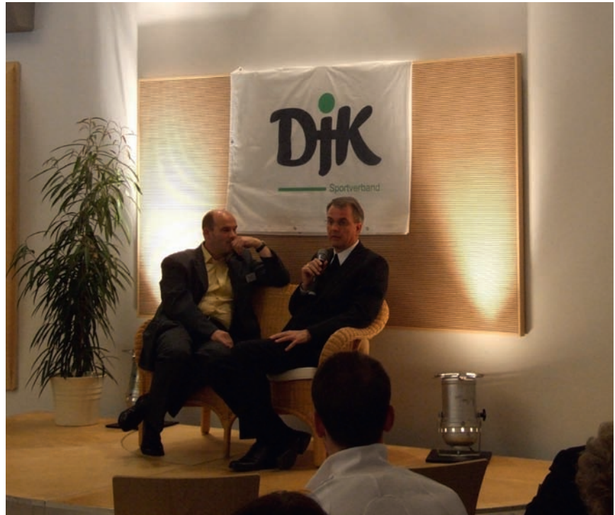
Bereits beim DV-Tag im April 2010 durften wir Weihbischof Peters als Ehrengast begrüßen.

Freuen Sie sich heute schon auf zwei besondere Tage an der Mosel und tragen Sie sich den Termin als „Pflichtveranstaltung 2012“ im Kalender ein. Ein Besuch lohnt sich! Bitte weitersagen!