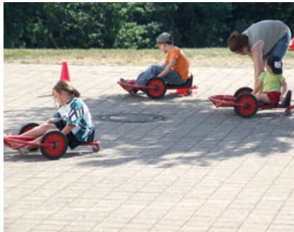
Dreirad. Mobil auf drei Rädern und das mit eigener Muskelkraft.

Thema „Spielfest im Verein“. Dabei ging es um Versicherungs- und Haftungsfragen, um Gema-Gebühren, um Ausleihmodalitäten und Zuschusstöpfe, um Ablauf- und Checkpläne aber auch gerade um schöne Spielanregungen. Die kompletten Informationen werden in einer ansprechenden Broschüre für die DJK-Sportvereine aufbereitet und als