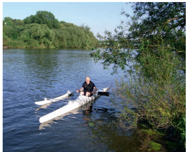
Mit dem Outrigger unterwegs.

Stechpaddel trainieren. In Neuseeland zählt dies zu den Nationalsportarten, ist jedoch wegen der Trägheit des Bootes nicht für lange Wanderungen geeignet. Beim Zweier paddelt ein Kanute links und der andere rechts. Der Hintermann übernimmt die Steuerfunktion. Bei einem symmetrischen Canadier kann es mitunter für den Anfänger schwierig sein, Bug und Heck zu unterscheiden. Im Bug (Vorne) ist der Platz bis zum ersten Sitz, nämlich für die Beine des Vordermannes, größer (vgl. Schönfeld, Ralf, 2004: Das Canadier Handbuch. Leitfaden für den Umgang mit dem Wander-Canadier für Einsteiger).