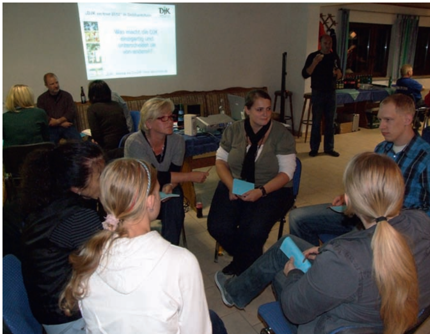
Angeregt diskutierten die Teilnehmer bei DJK on Tour 2010.

„DJK setzt Zeichen – Akzente für mehr Menschlichkeit im Sport“, so lautet das Motto der diesjährigen „DJK on Tour“-Reihe. Bei den regionalen Begegnungen im Herbst werden intensive Gespräche zum Thema „Menschlichkeit im Sport“ erwartet. Die DJK steht für einen humanen Sport, dabei rückt sie immer wieder den Menschen in den Mittelpunkt ihres Handelns. Der Dialog wird sich mit dem Anspruch an unsere DJK-Vereinsarbeit beschäftigen und diesen mit der Vereinsrealität hinterfragen. Dabei werden uns unterschiedliche Fragestellungen beschäftigen. Es wird in einem ersten Schritt darum gehen heraus zu stellen, was uns in der DJK-Vereinsarbeit wichtig und wertvoll ist? An diesen Thesen oder Anforderungen sollen dann Programme und Konzepte gemessen werden. Erfüllen wir mit unserer Vereinsarbeit unsere Überlegungen oder müssen wir Korrekturen und Veränderungen vornehmen? Freuen wir uns auf spannende und interessante Diskussionen über die Qualität der DJK-Arbeit.