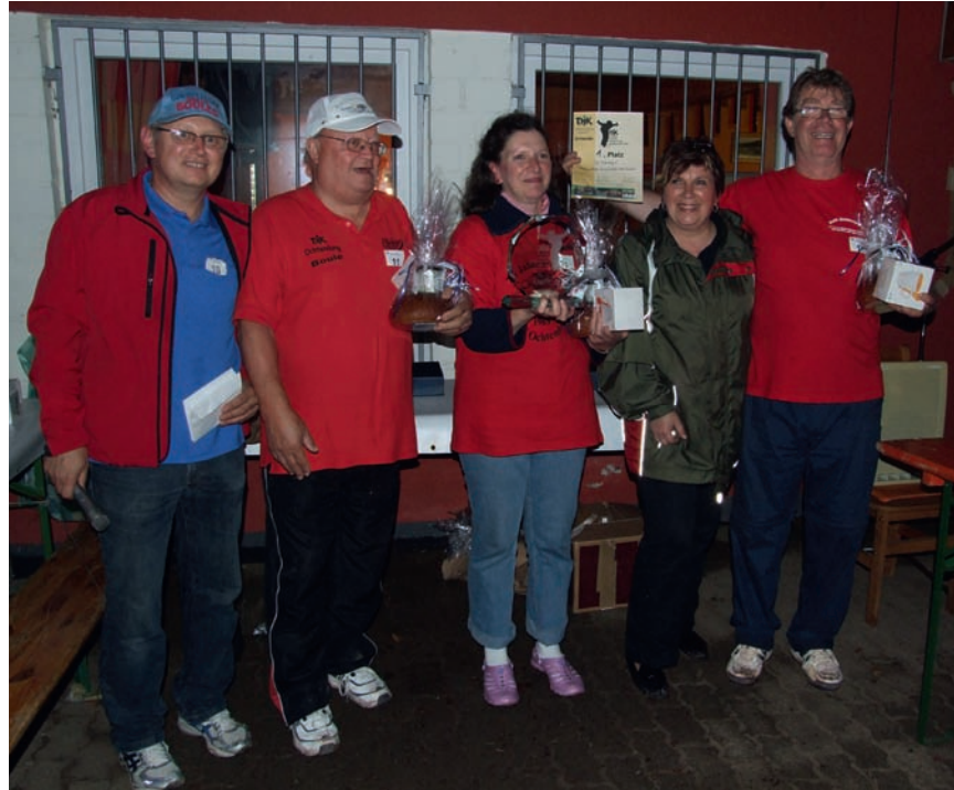
Sieger. Überraschend landete das DJK-Team Ochtendung II auf dem Siegerpodest und konnte den begehrten Glaspokal mit nach Hause nehmen.

knappsten Ergebnis 13:12. Die engen Begegnungen brachten es mit sich, dass bis zur Dämmerung gespielt wurde. Da sich die Mannschaften aus Bous und Betzdorf den dritten Platz teilten, konnten alle Anwesenden gemeinsam ein packendes Finale zwischen Ochtendung 2 und Hülzweiler 2 verfolgen. Die Dramaturgie war einmalig und unbeschreiblich: Vielleicht hatten sich die erfahrenen Spieler der DJK Hülzweiler gegen den Außenseiter aus Ochtendung zu sicher gefühlt, jedenfalls führten die Eifelaner schnell mit 12:4. Eine Überraschung lag in der Luft, nur noch ein Punkt fehlte. Aber auf einmal war die Gelassenheit des Außenseiters wie weggeblasen, die Saarländer holten Punkt für Punkt auf und plötzlich stand es 12:12. Die nächste Aufnahme musste die Entscheidung bringen. Ein super Anwurf des Ochtendunger Teams sorgte für eine kaum erwartete Entscheidung und brachte den Sieg.