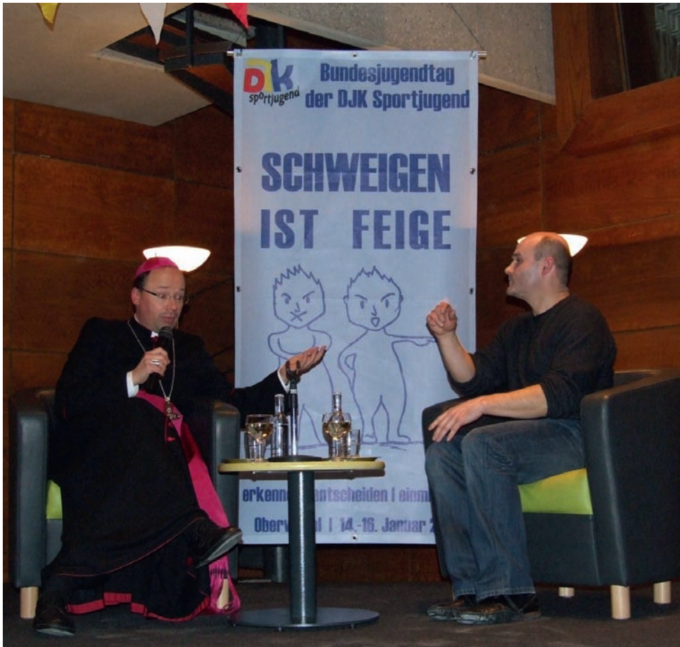
Bischof im Dialog.