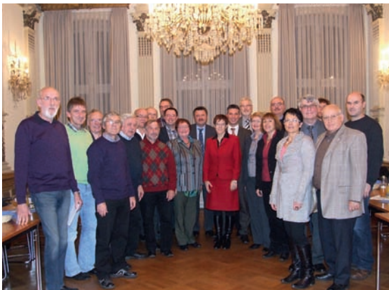
Mittelpunkt. Die angehende Ministerpräsidentin Annegret Kramp-Karrenbauer mitten im Kreis der DJK-Vertreter/innen.

Der DJK-Landesverband Saarland hatte die Vorsitzenden seiner 38 DJK-Sportvereine sowie die beiden DJK-Diözesanverbände Trier und Speyer zu einem interessanten Gespräch mit Ministerin Annegret Kramp-Karrenbauer nach Saarbrücken eingeladen. Sehr aufmerksam, konzentriert und routiniert gestaltete sich das Gespräch, das die Ministerin für Arbeit, Familie, Prävention, Soziales und Sport mit den anwesenden 25 DJK-Vertreter/innen führte. Dabei wurden sehr unterschiedliche Themenkomplexe angesprochen und fachlich versiert von Annegret Kramp-Karrenbauer beantwortet.