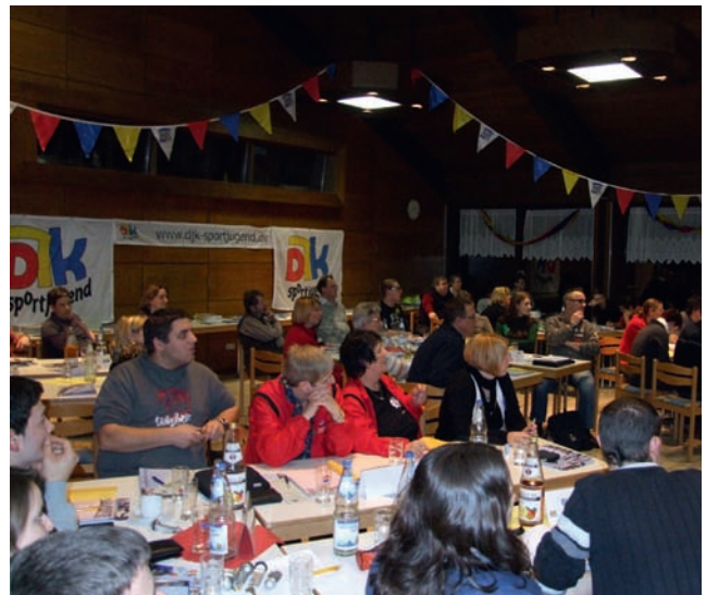
Aufmerksam und konzentriert.

Im Weiteren berichtete die Bundesjugendleitung über die verschiedenen Aktionen, die im vergangenen Jahr gelaufen